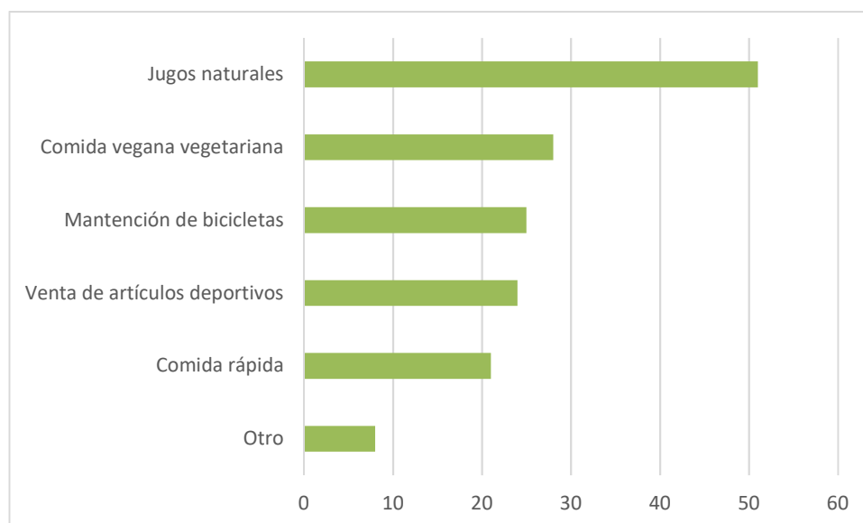
Tipo de comercio o servicios preferidos en el sector Los Canelos.

Dentro de las preferencias del tipo de comercio, destaca la venta de jugos naturales, seguido por comida vegana/vegetariana y la mantención de bicicletas, lo que queda representado en el siguiente gráfico.